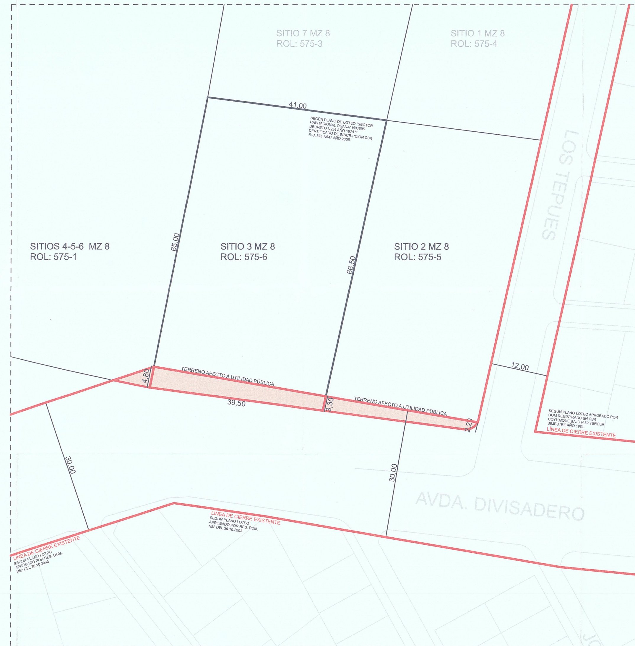
SITUACIÓN ACTUAL SITIOS 2 - 3 - 4 - 5 - 6 MZ 8 ESC. 1:500